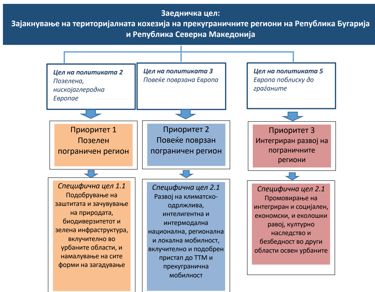
Слика бр. 1.2-2 Тематска концентрација на ППС 2021-2027 меѓу Република Бугарија и Република Северна Македонија

Програмата ги идентификува следните Општи цели , Цели на политиките (од Предлогот за општа регулатива), и поврзани Приоритети , Специфични Цели , и Поддршка на Активности/Инвестиции :